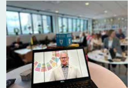
A Sustainable Tomorrow

Human Rights Festival (HRF) är Sveriges första festival som fokuserar på mänskliga rättigheter och arrangeras av Altitude Meetings och Raoul Wallenberg-institutet. En plats där människor kan lära sig mer om mänskliga rättigheter och inspireras till lokalt och regionalt engagemang. Festivalen genomfördes med stöd av projektmedel från bland annat stiftelsen.