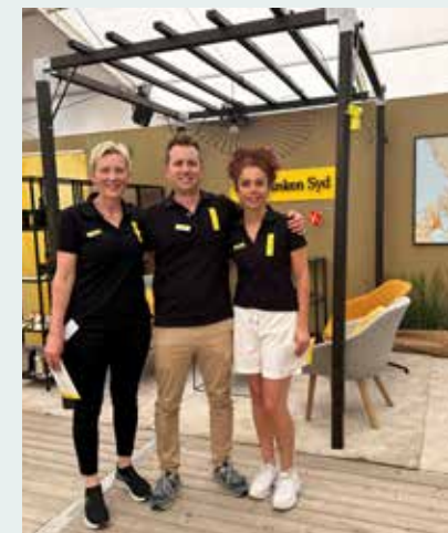
Sparbanken Syd på Borgeby Fältdagar

Under 2024 har vi sponsrat mer än 94 föreningar och stiftelsen har tilldelat bidrag till 75 olika projekt och verksamheter