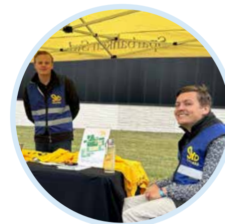
SYDdagarna Sparbanken Syd

Vi medverkar årligen på Borgeby fältdagar som i år hade temat framtidens lantbruk. Lantbruket är en av de branscher som år efter år ökar sin effektivitet absolut snabbast och det investeras stora summor världen över på att förse lantbruket med nya innovationer, nya grödor, nya hjälpmedel och mycket annat som tillsammans skapar nya möjligheter. I år lyftes frågor om allt från anpassning av produktion i fält och stall till vem som kommer driva våra lantbruk i framtiden. Detta är en viktig arena för oss, då vi arbetar tätt med våra lantbrukskunder och är starka i lantbruksaffären.