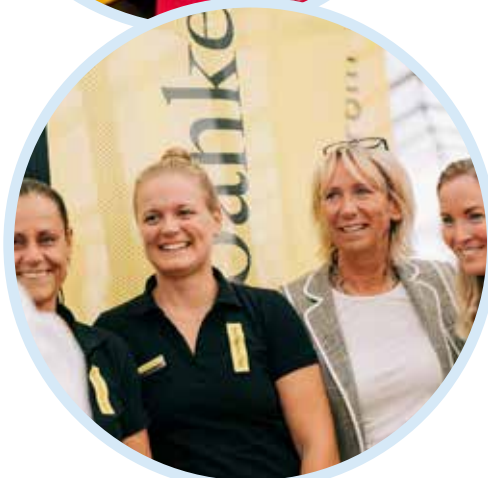
Sparbanken Syd på plats på Ystad Summit