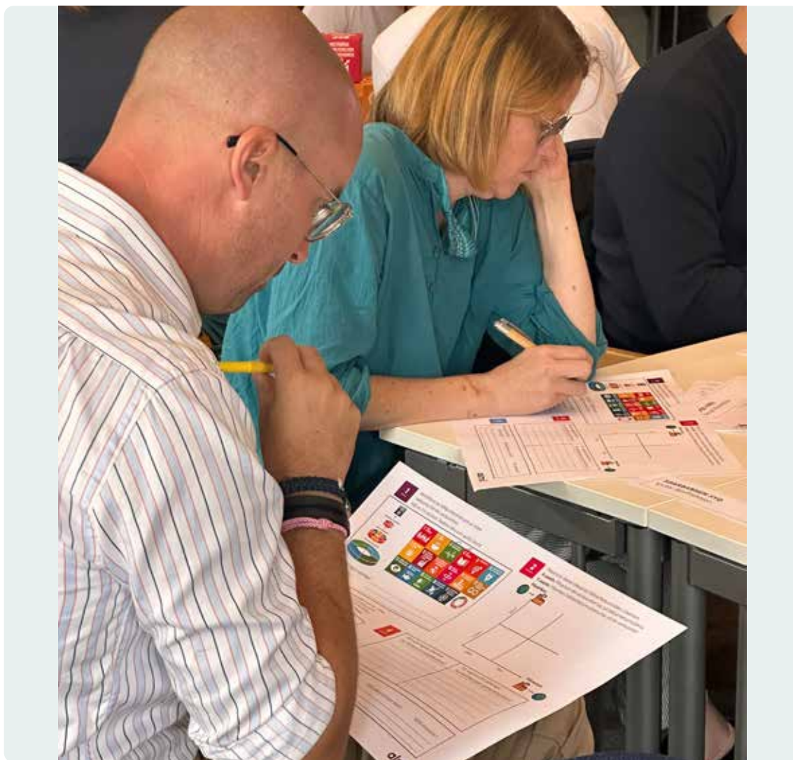
En ögonblicksbild från workshopen "Med målen i sikte"