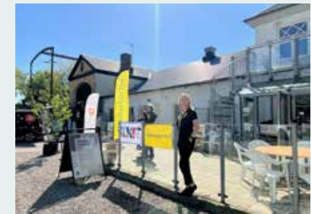
Klimatfestivalen i Tomelilla