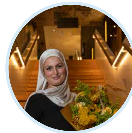
Boost by FC Rosengård